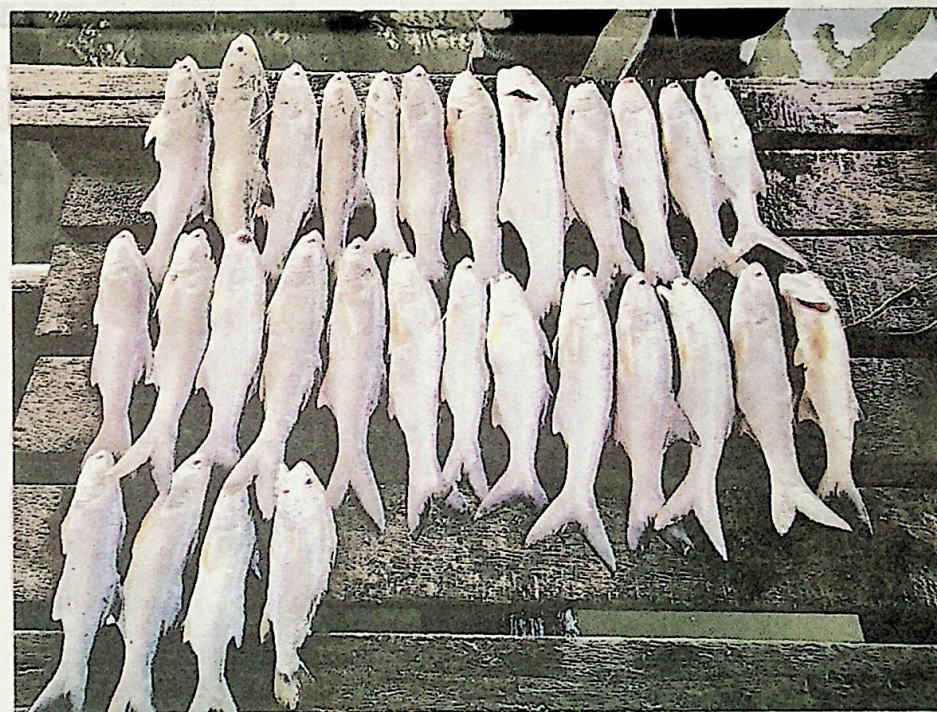
IKAN senangin banyak ditemui di sekitar Sungai Kuantan terutamanya bermula bulan April sehingga musim tengkujuh.

"Bagi sewaan bot memancing di sungai, bayaran dikenakan adalah