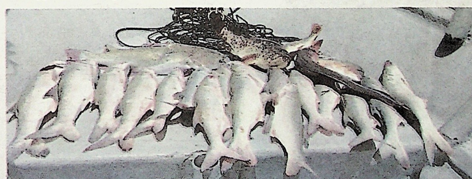
HASIL pancingan ikan senangin dan ikan-ikan lain yang diperolehi salah seorang pemancing tegar di Sungai Kuantan.