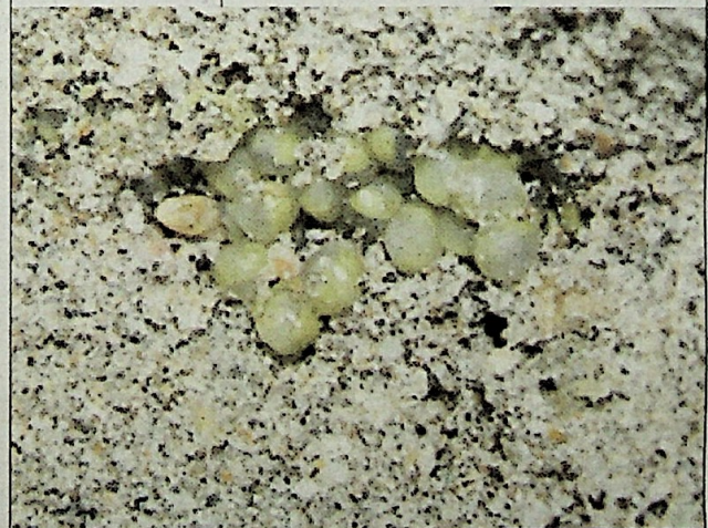
Telur belangkas yang ditimbus pasir.