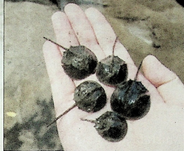
Anak belangkas yang terdapat di Mud Setiu.

Berdasarkan tinjauan lapangan HCRG di Pahang, mendapati nisbah belangkas di perairan Cherating ialah 1 betina: 14 jantan, menunjukkan impak