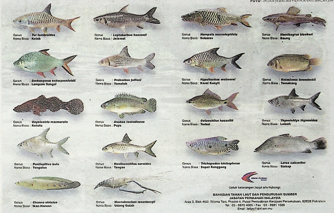
SPESIES ikan asli di Malaysia

“Selain itu, pengenalan genus ini di perairan umum tanpa kawalan akan mengganggu, keseimbangan