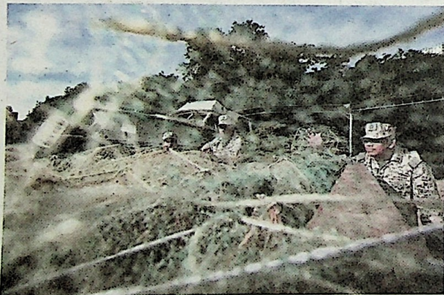
SEBAHAGIAN bubu naga dilupuskan melalui kaedah hancur musnah di Limbongan Batu Maung.

Unresolved Maritime Boundary terletak pada 80 batu nautika dari barat Pulau Kendi, iaitu kawasan perairan yang dituntut Malaysia dan Indonesia.