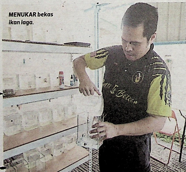
MENUKAR bekas ikan laga.

Tidak campur dalam bekas sama antara tip pastikan ikan laga kekal aktif