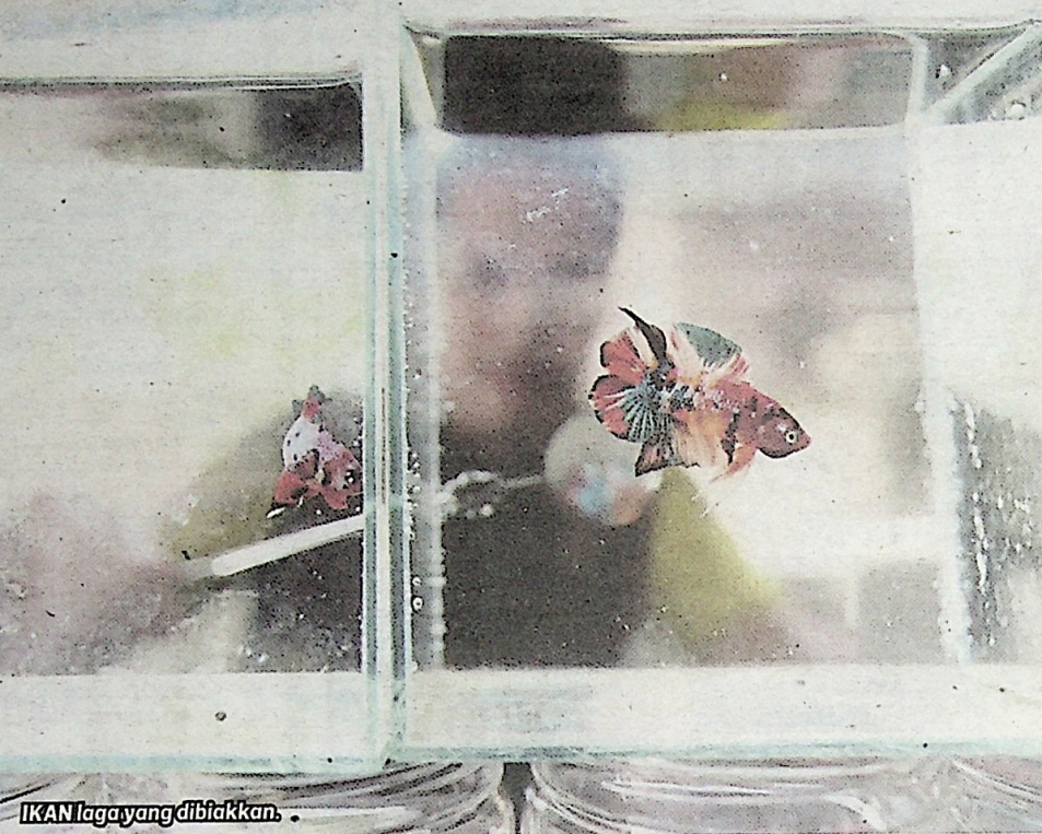
IKAN laga yang dibiakkan.