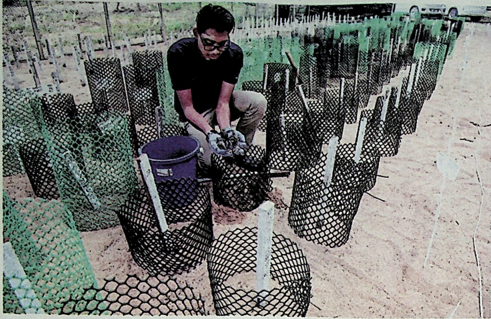
KAKITANGAN Jabatan Perikanan Terengganu mengumpul anak penyu agar sebelum dilepaskan ke laut di Pusat Santuari Penyu Ma'Daerah, Kerteh, Kemaman.

pencemaran dan pembangunan juga antara faktor penyu belimbing pupus di Rantau Abang.