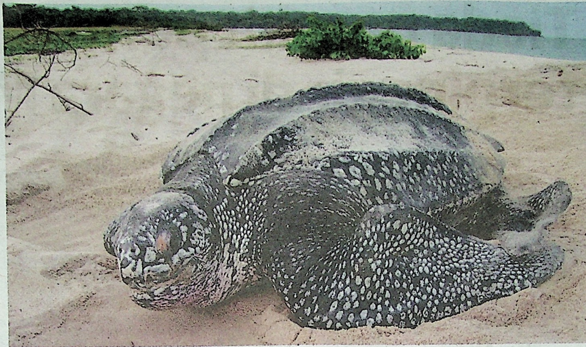
KALI terakhir pendaratan penyu belimbing direkodkan di Terengganu ialah pada 2017.