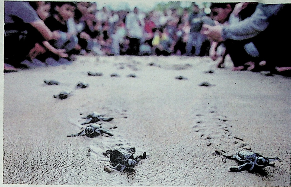
ORANG ramai teruja berpeluang melihat dengan lebih dekat anak-anak penyu agar yang dilepaskan di Pantai Kelulut, Marang, Terengganu.

punca penyu belimbing merajuk sehingga tidak ingin mendarat lagi di Rantau Abang.