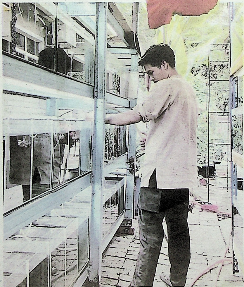
RUTIN harian seperti penukaran air sebanyak 30 peratus setiap hari.

“Kalau keperluan lain macam penguji pH, media untuk kawal suhu air, antiklorin dan photosynthetic bacteria ,” katanya.