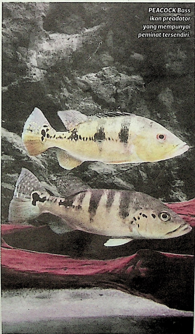
PEACOCK Bass ikan predator yang mempunyai peminat tersendiri.

"Manakala jenis yang ditenak dijual sedikit tinggi kerana ia lebih mudah untuk dijaga kerana sudah dilatih untuk makan palet sejak dari kecil. Seperti saya mempunyai tiga spesies yang dibeli dari penternak iaitu Blue Azul, Kalberi dan Orino. Manakala, spesies Monoculus berasal