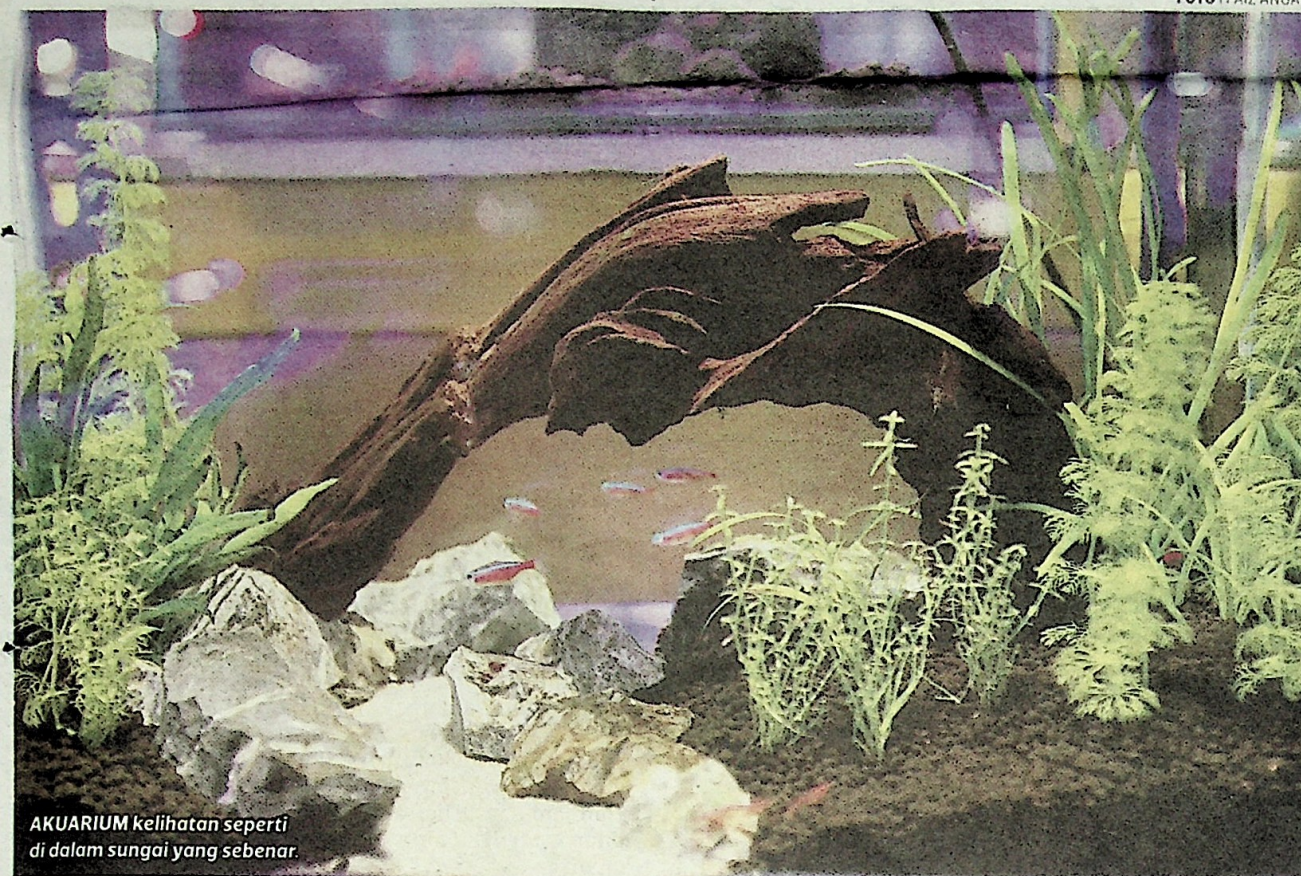
AKUARIUM kelihatan seperti di dalam sungai yang sebenar.