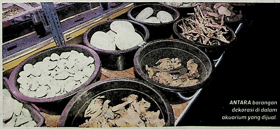
ANTARA barangan dekorasi di dalam akuarium yang dijual.