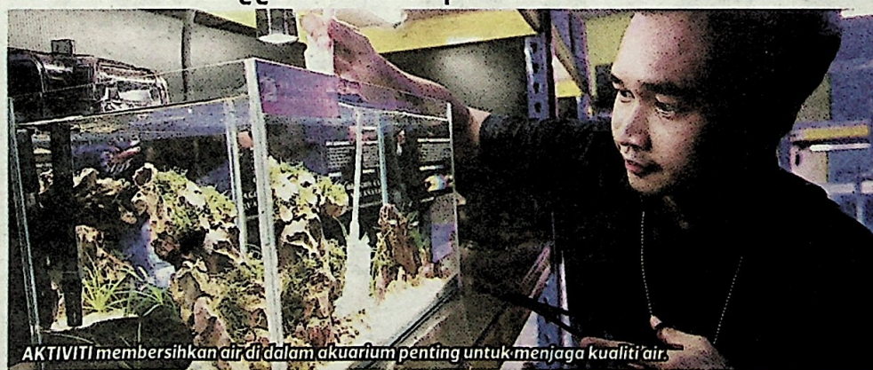
AKTIVITI membersihkan air di dalam akuarium penting untuk menjaga kualiti air.