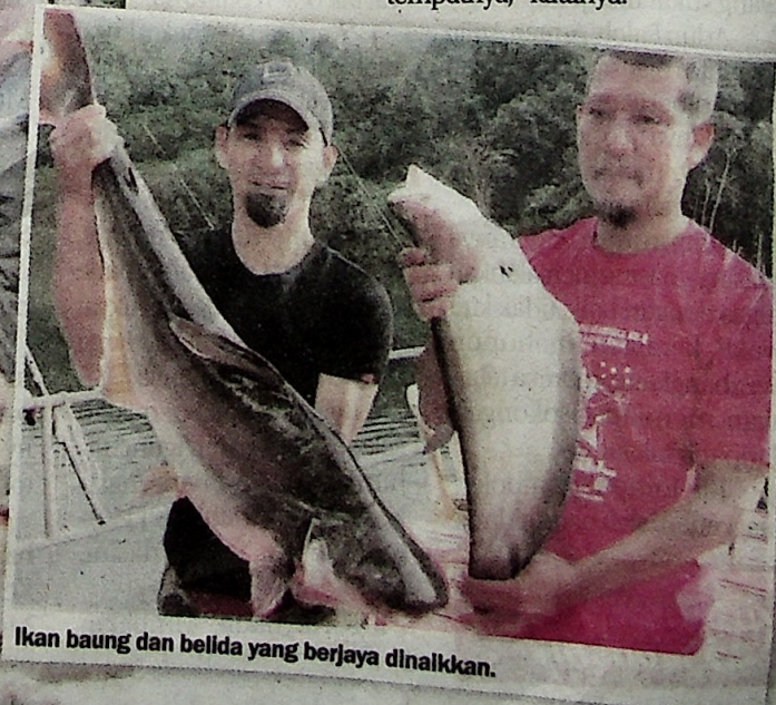
Ikan baung dan belida yang berjaya dinaikkan.