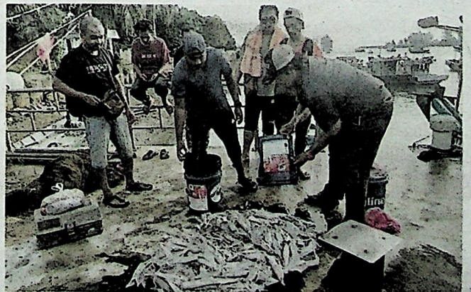
Lambakan sotong yang berjaya ditangkap menerusi aktiviti mencandat.

Namun, pendapatan lumayan seperti itu bukan selalu diperoleh kerana ia bergantung kepada nasib serta keadaan cuaca semasa dan ada ketikanya pulang dengan beberapa kilogram sotong sahaja.