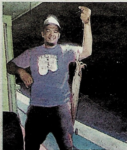
Sotong bersaiz besar yang berjaya dinalkkan hasil teknik mencandat.

Tambahnya, walaupun hasil tangkapan sotong tidak banyak kerana faktor bulan gelap tetapi mereka berpuas hati dengan apa yang diperoleh dan paling utama, pengalaman itu tidak dapat dijual beli.