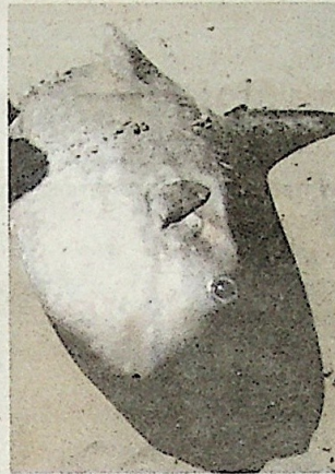
Ikan mola mola yang ditemui mempunyai ukuran panjang hampir satu meter.

Ikan itu mendapat nama dari perkataan mola yang berasal dari bahasa latin bererti batu giling yang berbentuk bulat dan pipih (leper) jadi nama mola mola merujuk kepada bentuk