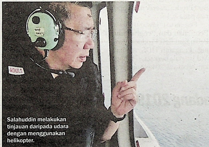
Salahuddin melakukan tinjauan daripada udara dengan menggunakan helikopter.

gara dan kerajaan tidak akan berganjak," katanya selepas menyaksikan pelupusan vesel penangkapan ikan asing di perairan