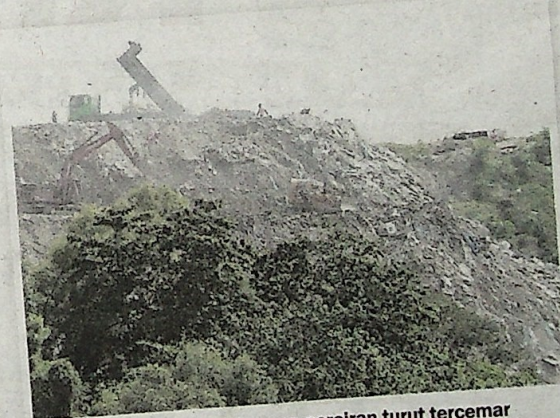
Nelayan mendakwa kawasan perairan turut tercemar akibat tambakan di tapak pembuangan sampah.

"Kesan tambakan untuk buat tapak pelupusan sampah itu dapat tengok sekarang. Asalnya ia adalah laut dan menjadi darat dan lama kelamaan ia jadi bukit apabila banyak sampah dibuang di situ. "Saya kesal kerana projek yang