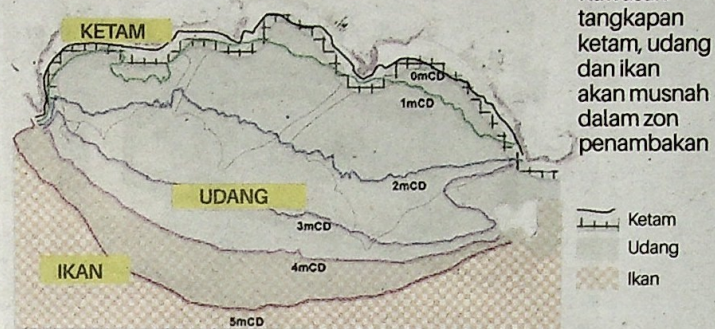
Rajah kawasan tangkapan hasil laut yang akan ditambak di Pulau Pinang.

sa import dari Thailand, India, Pakistan atau mana-mana negara pembekal. Malangnya apabila kita import ikan itu, ikan tersebut ada bahan kimia untuk kekalkan kesegarannya, jadi rakyat akan makan ikan kimia.