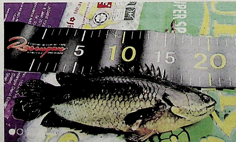
Ikan puyu yang diukur sepanjang 20 sentimeter.