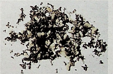
Telur kerengga adalah antara umpan paling ampuh untuk memancing puyu.