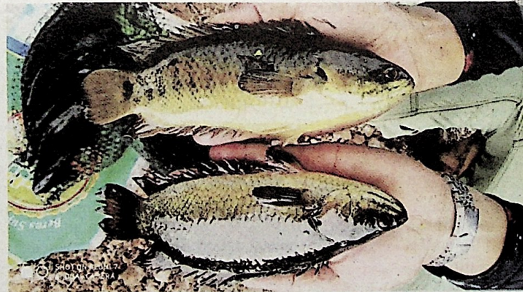
Ikan puyu yang bersaiz sebesar tapak tangan.