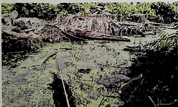
Lubuk puyu yang bakal lenyap tidak lama lagi.