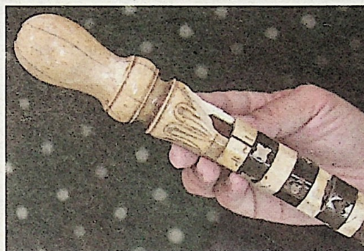
Ukiran aksara Arab tertulis 1312 Hijrah pada hulu tongkat khutbah tersebut bersamaan 1895 Masihi, diyakini merupakan tahun pembuatan sebatang tongkat khutbah yang terdapat di Masjid Losong Haji Mohd.

Jelas beliau, usia tongkat khutbah itu juga seiring dengan usia pembinaan Masjid Losong Haji Mohd yang sedia ada kini iaitu sekitar penghujung 1890-an. Masjid tersebut dibina baharu kira-kira 50 meter dari tapak masjid lama.