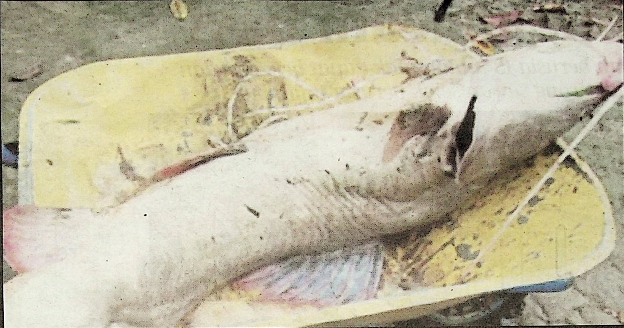
IKAN baung merah yang mengena tajur dipasang Roslan.

Katanya, kewujudan ikan baung merah atau