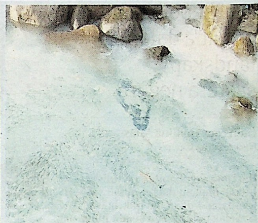
Lokasi strategik di Pulau Lang Tengah bagi projek kelestarian ekosistem dan konservasi.

terjaga, sesuai untuk kegiatan rekreasi air memberikan pengalaman unik bagi yang gemarkan cabaran alam semula jadi.