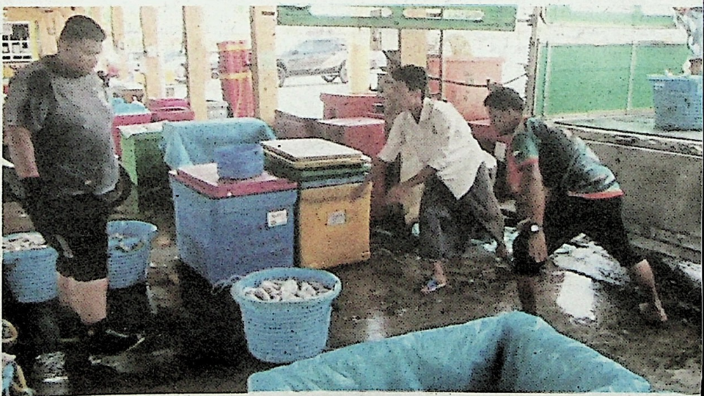
NELAYAN mengeluarkan sotong yang ditangkap dari atas bot.