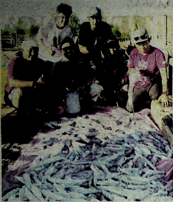
SEKUMPULAN pencandat sotong menunjukkan hasil tangkapan yang diperoleh mereka.

"Pendapatan itu dapatlah saya dan awak-awak bayar hutang bot dan buat perbelanjaan pada musim tengkujuh nanti," katanya.