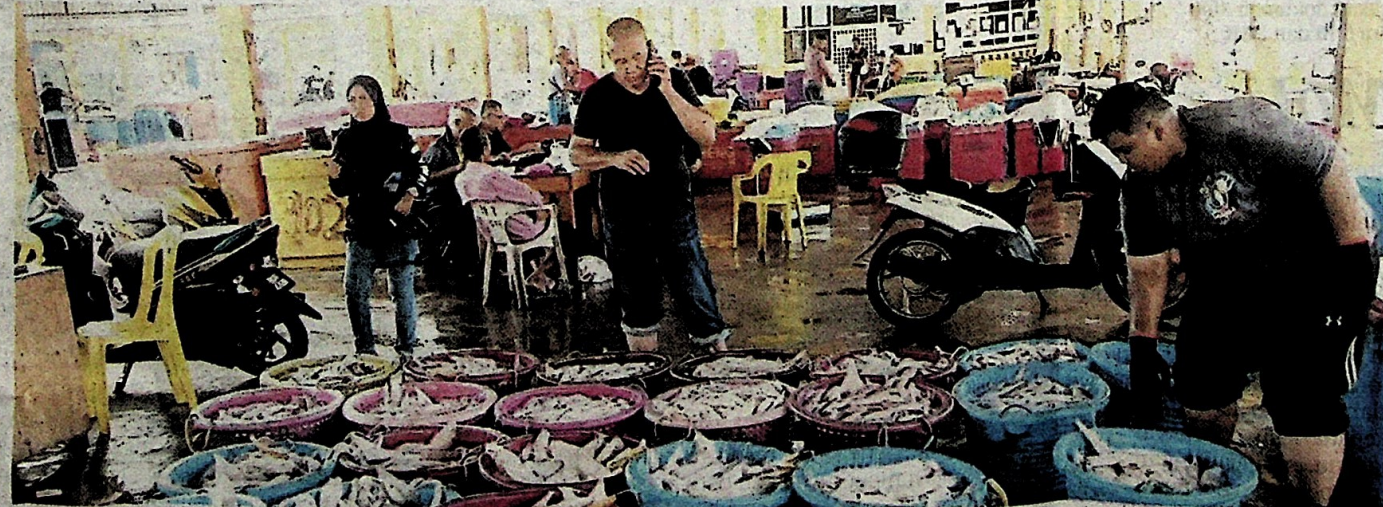
SOTONG yang siap dipindahkan dibawa ke Kompleks LKIM untuk dijual.