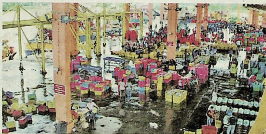
Pembinaan ECRL bakal menjadikan Tok Bali sebagai exit point akan mengembangkan lagi industri perikanan.

"Sebagai contoh jeti pendaratan ikan milik LKIM di Tok Bali akan memberi kemudahan kepada nelayan tempatan dan sekitarnya