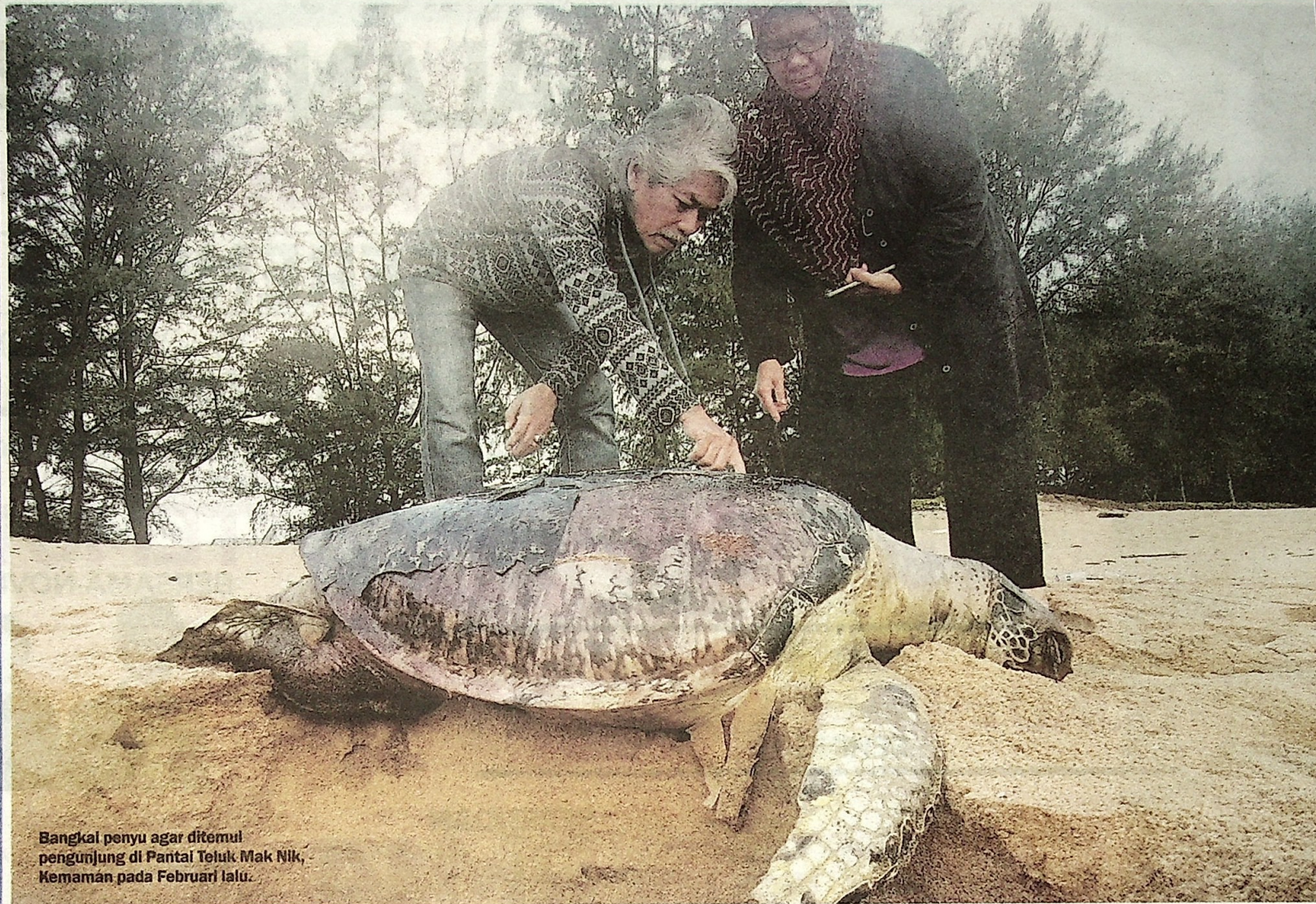
Bangkai penyu agar ditemui pengunjung di Pantai Teluk Mak Nik, Kemaman pada Februari lalu.