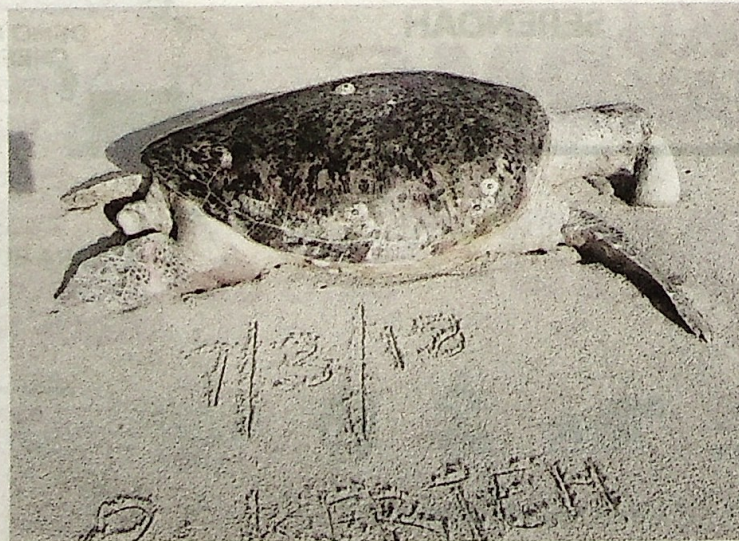
Bangkai penyu yang dijumpai di Pantai Kerteh pada Mac lepas.

Kepupusan haiwan ikon Terengganu itu semakin serius