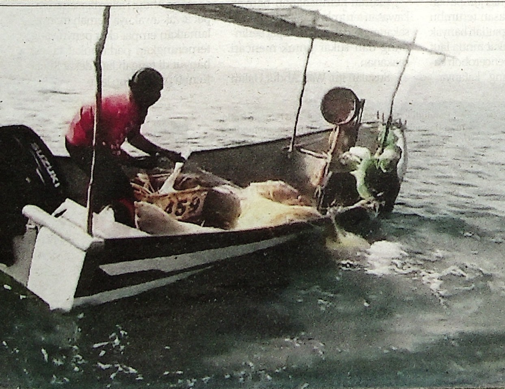
Penguatkuasaan yang dilakukan pada 2016 berjaya menahan nelayan bersama pukuk pari yang tersangkut penyu.