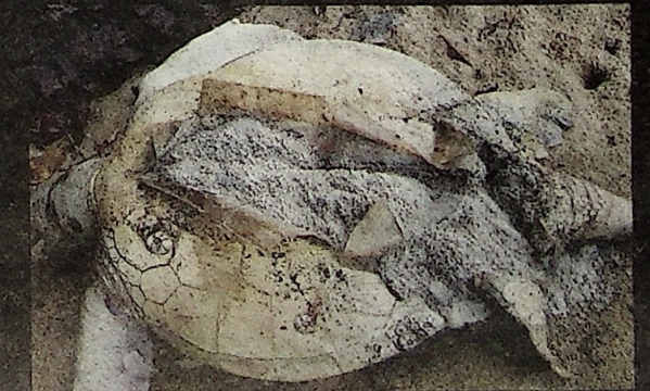
Bangkai turut ditemui dalam keadaan reput.

"Ia jadi pengalaman yang saya tak dapat lupa tapi kes kematian penyu disebabkan gangguan sebegini cuma kes terpencil dan punca utamanya adalah disebabkan penggunaan pukuk pari," katanya.