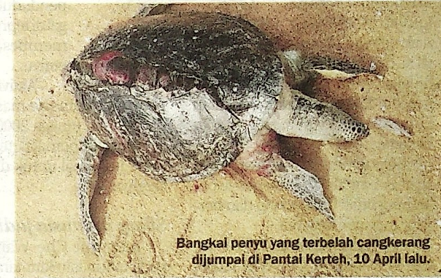
Bangkai penyu yang terbelah cangkerang dijumpai di Pantai Kerteh, 10 April lalu.