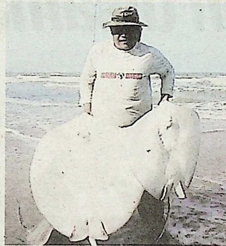
Antara ikan pari bersaiz mega yang berjaya dipancing di Pantai Sepat.