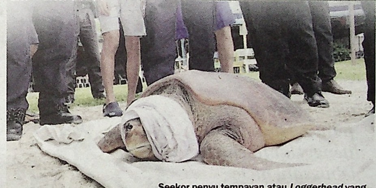
Seekor penyu tempayan atau Loggerhead yang jarang ditemui di perairan Semenanjung Malaysia dilepaskan semula ke laut di pesisiran Pantai Pasir Belanda, Pulau Pinang baru-baru ini.