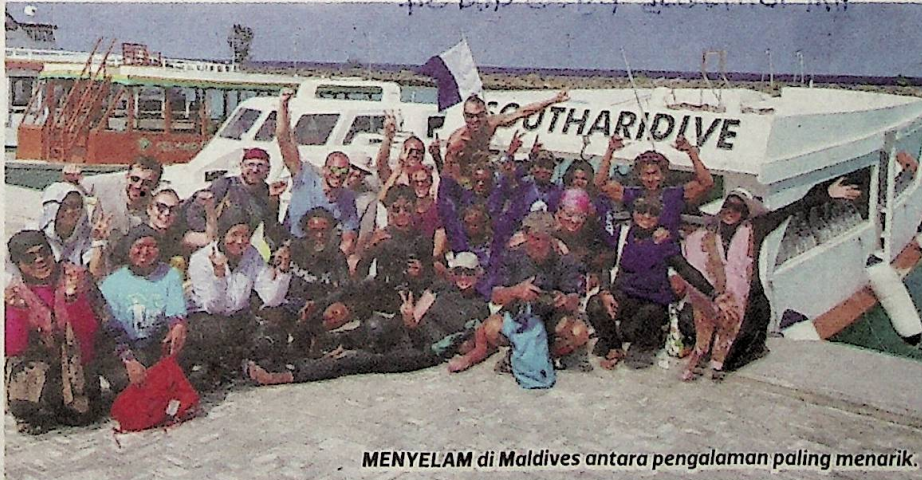
MENYELAM di Maldives antara pengalaman paling menarik.