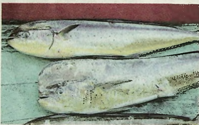
Perbezaan jantina ikan dorado terpampang pada bahagian kepala. Betina (atas) dan jantan (bawah).

Ikan belitong juga dieja belitung atau dorado merupakan satu spesies yang kuat, laju, akrobatik dan mempunyai warna yang sangat menarik. Padanan ciri-ciri ini cukup menjadikan ia spesies yang menjadi buruan dan hiburan kaki pancing. Lompatan akrobatik saat pancaran tegak cahaya matahari pada warna badannya cukup mempesonakan.