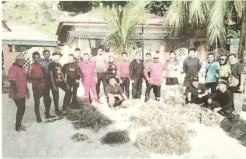
Penyelam bersama pukat yang berjaya dibawa naik ke darat di Pulau Perhentian.