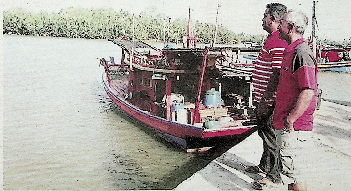
Bot kelas A tersadal di jeti Tanjung Che Mas apabila air di muka kuala cetek menyebabkan nelayan tidak dapat turun ke laut.