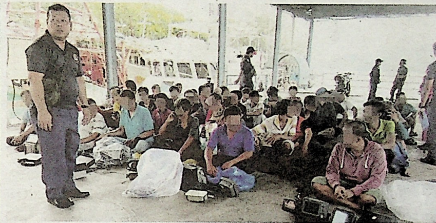
Seramai 37 tekong dan awak-awak yang ditahan berusia antara 21 hingga 60 tahun.

T aktik terbaharu nelayan asing untuk merompak hasil laut negara dengan menangkap ikan sekitar sempadan Malaysia-Vietnam berjaya dibongkar Agensi Penguatkuasaan Maritim Malaysia (Maritim) selepas penahanan enam bot nelayan Vietnam.