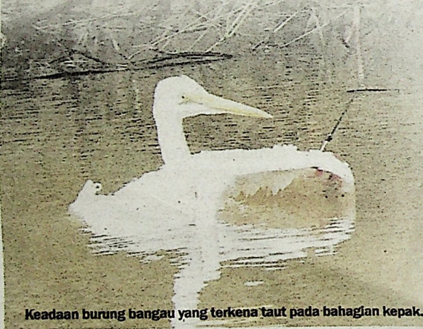
Keadaan burung bangau yang terkena taut pada bahagian kepak.

"Di Terengganu, semua alatan nelayan darat belum dilesenkan termasuk taut sebab tiada enakmen yang mewajibkan," katanya.