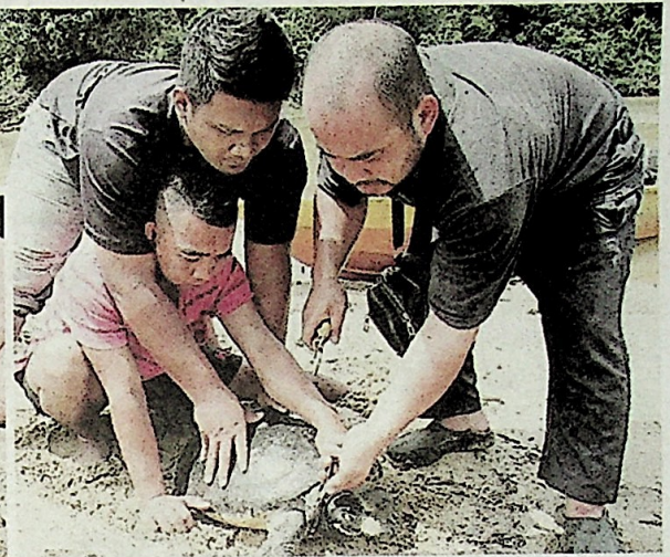
Tiga sukarelawan TCS berusaha mengeluarkan mata kail yang terkena pada badan tuntung jantan.

ngai dan ia lazimnya diumpan dengan ikan atau perut ayam serta seringkali digunakan penduduk setempat untuk menangkap ikan.