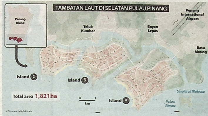
Peta menunjukkan tiga pulau buatan yang akan dibina di selatan Pulau Pinang.