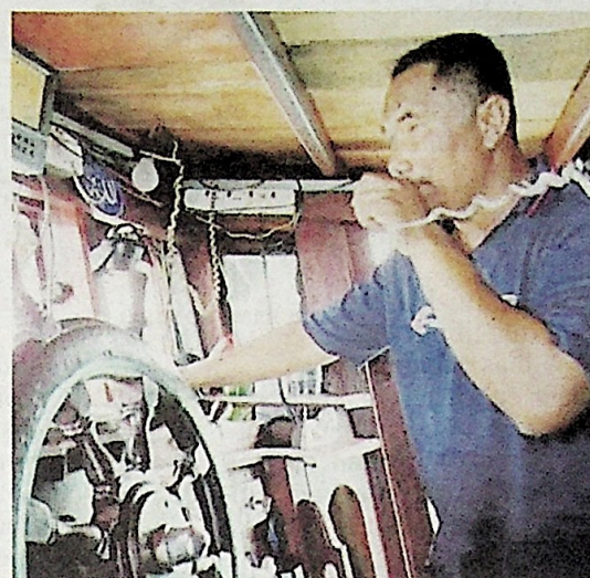
Hazahar ketika mengemudi botnya sebelum ini.

"Saya tidak tahu masa itu mahu percaya atau tidak, saya hampir rebah dan terus mendapatkan maklumat lanjut daripada pihak berkuasa untuk pengesahan. Saya sempat jumpa suami pada jam 4 pagi di unit kecemasan HRPZ II tapi dia sangat letih dan dia kata dia