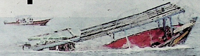
Bot dinaiki mangsa yang karam ditunda ke muara Kuala Kemasin.