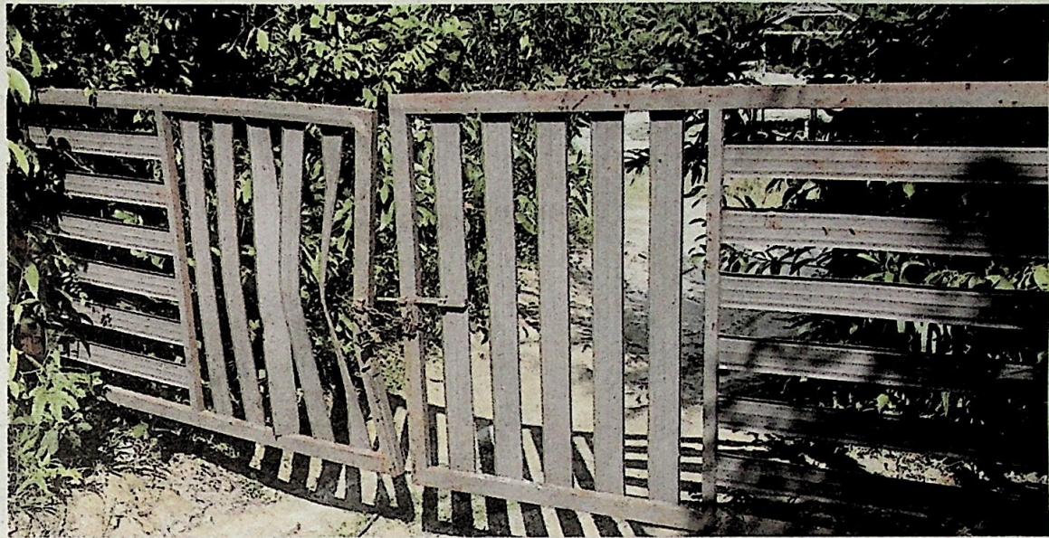
Laluan masuk utama ke sebuah kawasan bekas lombong turut dikunci bagi menghalang nelayan darat masuk ke kawasan itu untuk menangkap ikan.

Katanya, di kawasan Sungai Galah di daerah Perak Tengah, daripada 20 bekas lombong yang ada di kawasan itu, hanya lima bekas lombong yang boleh digunakan dan selebihnya sudah di-