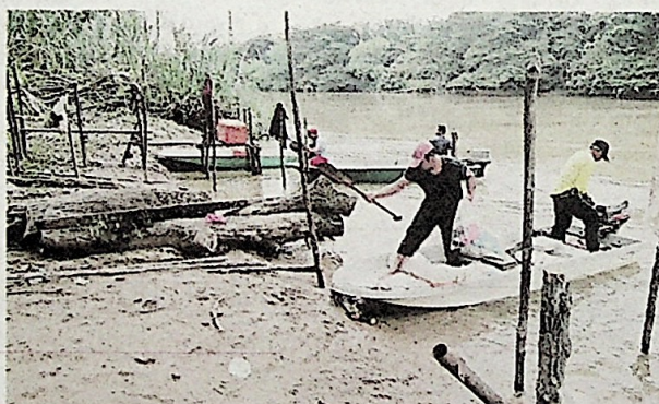
Nelayan darat di Perak memerlukan bantuan kerajaan untuk mewartakan kawasan bekas lombong sebagai kawasan perikanan darat untuk memudahkan mereka mencari rezeki tanpa gangguan pihak tertentu.

"Malangnya, nelayan darat berdepan pula de-