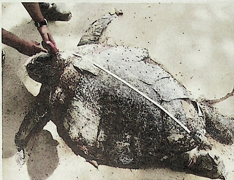
Penyu berusia lebih 20 tahun ditemui mati di pantai Port Dickson.