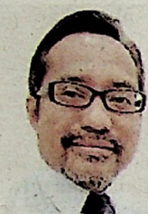
Pengarah Institut Asia Hal Ehwil Antarabangsa dan Diplomasi (AIHAD), Universiti Utara Malaysia (UUM)