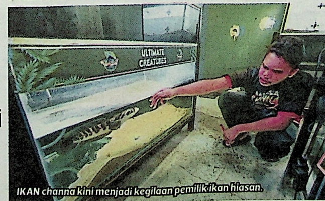
IKAN channa kini menjadi kegilaan pemilik ikan hiasan.