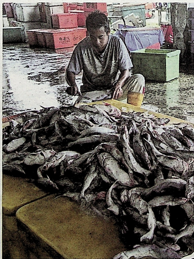
PERAIRAN negara kaya dengan pelbagai hasil laut sekali gus menarik perhatian nelayan asing untuk melakukan pencerobohan.