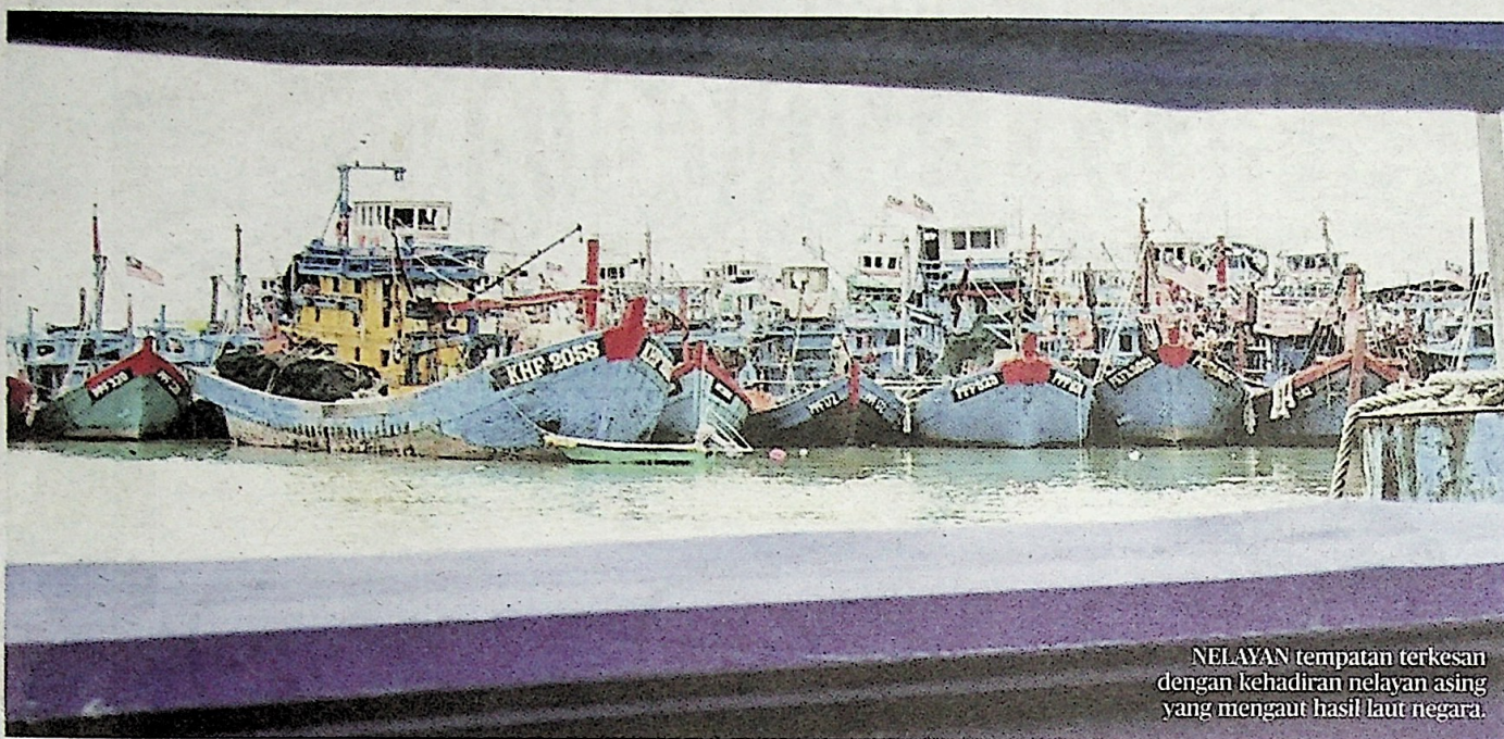
NELAYAN tempatan terkesan dengan kehadiran nelayan asing yang mengaut hasil laut negara.