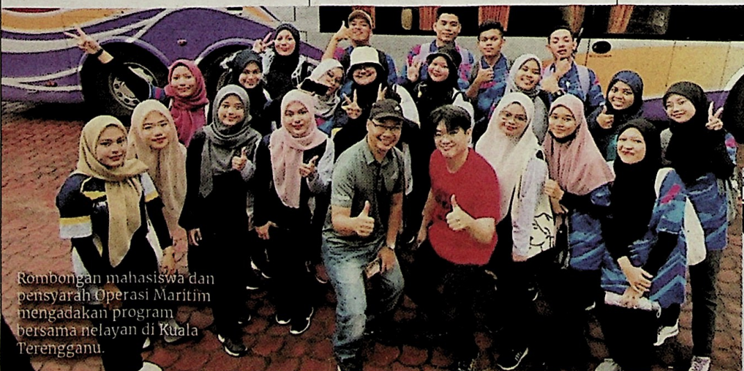
Rombongan mahasiswa dan pensyarah Operasi Maritim mengadakan program bersama nelayan di Kuala Terengganu.