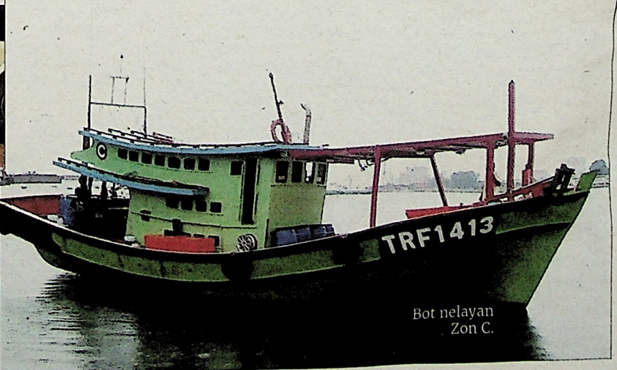
Bot nelayan Zon C.