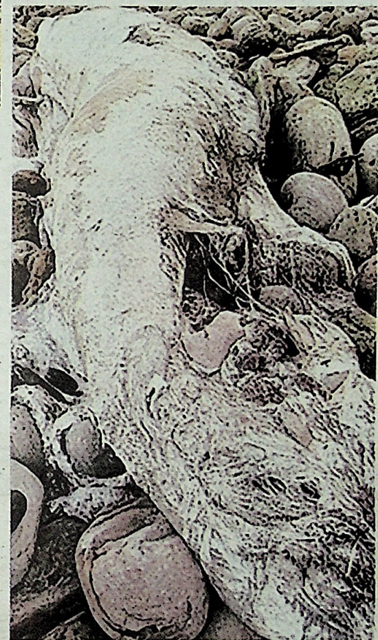
PENEMUAN makhluk aneh itu mengejutkan penduduk setempat di kawasan tersebut.

“Namun, sejujurnya, sukar untuk menyatakannya disebabkan keadaan bangkai makhluk yang mereput teruk,” terangnya.