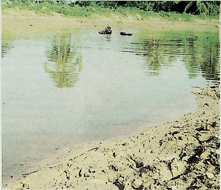
Sungai menjadi punca rezeki Pok Wei menyara keluarga.

"Kita guna bakul berjaring besi untuk memudahkan pasir bersama air mengalir keluar dan meninggalkan etak sahaja dalam bakul," katanya yang memberitahu bakul tersebut diikat pada